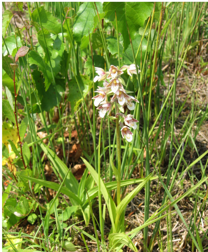
Epipactis des marais ( Epipactis palustris )

Une augmentation de la diversité animale et végétale semble se dessiner au regard des suivis scientifiques actuellement menés. En effet, les travaux ont permis de multiplier et d'augmenter la surface de zone humide. Cette tendance est notamment visible pour le groupe des odonates* et pour les plantes. À titre d'exemple, l' Epipactis des marais ( Epipactis palustris ) a été découverte durant l'été 2009. Il s'agit d'une orchidée assez rare, vulnérable et protégée en région Nord-Pas-de-Calais.