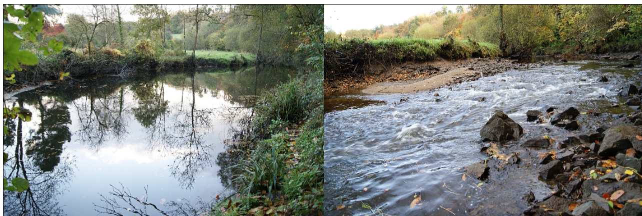
Avant et après travaux