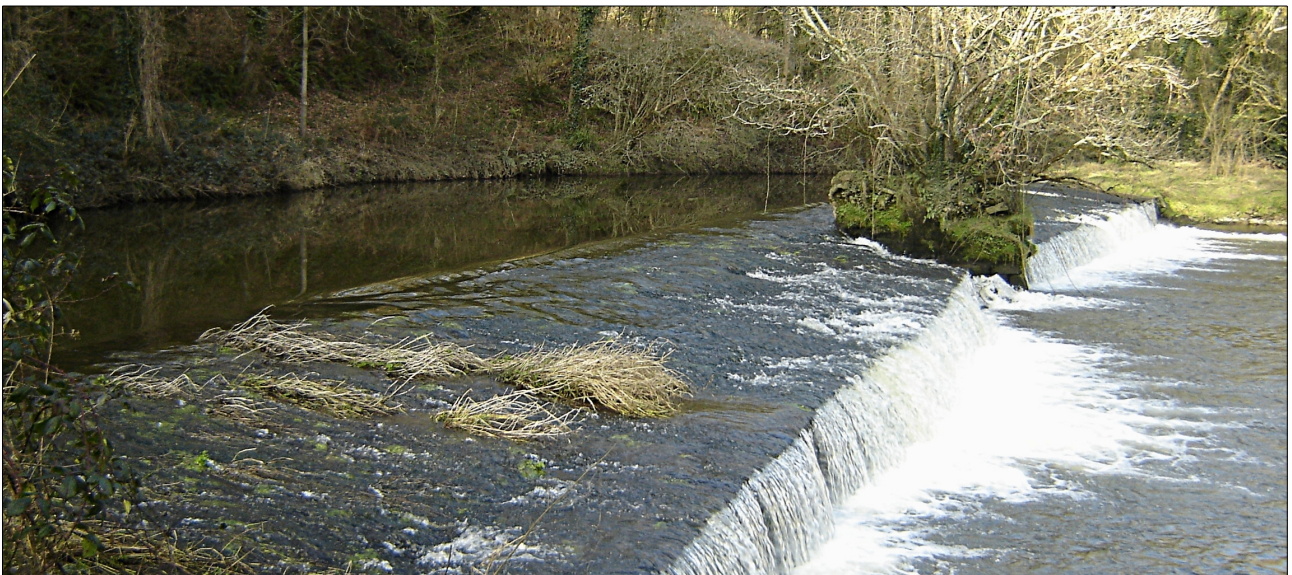
Barrage du Moulin du Houël avant les travaux

Afin de respecter les objectifs du Grenelle, une liste de 50 ouvrages à aménager d'ici 2012 a été établie à l'échelle du département des Côtes d'Armor. Cette liste résulte des propositions d'un groupe de travail animé par la DDTM. Le barrage du moulin du Houël figure dans cette liste.