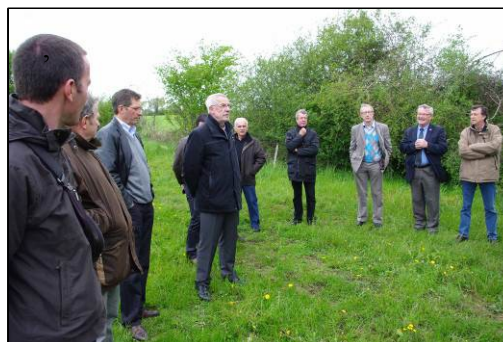
PNR Normandie Maine, Visite de terrain avec les partenaires du Contrat Nature

Un comité de suivi technique composé des différents partenaires cités ci-dessus se rassemble lors de la prise de décisions importantes, environ tous les 3 mois (variable selon les demandes).