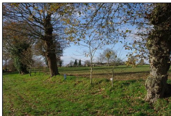
PNR Normandie Maine, Haie regarnie

Il est recommandé d'anticiper d'éventuels effets d'aubaine de ce type d'appels à projets, à savoir de fonder les actions sur des attentes concrètes dans les deux ans de réalisation du territoire.