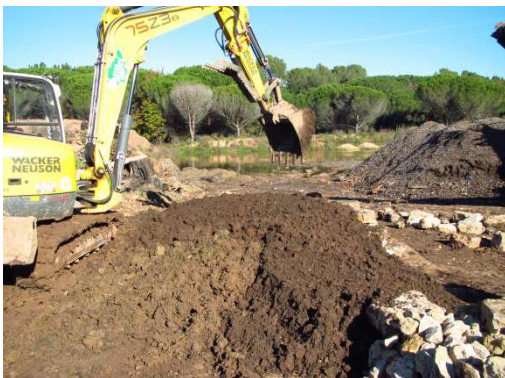
photo 16. Finition des apports de terre au godet mécanique et assurant une liaison en pente douce entre les deux modules. On distingue les deux couches de terre avec en brun sur le dessus la terre « arable » amendée en matière organique qui servirait de support de plantation.