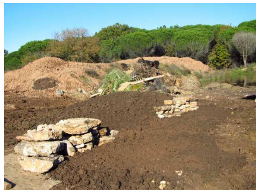
photo 17. Les deux modules terminés (avant plantations). Les structures alvéolaires sont enfouies. Seul apparaît en face avant le muret de pierres sèches.