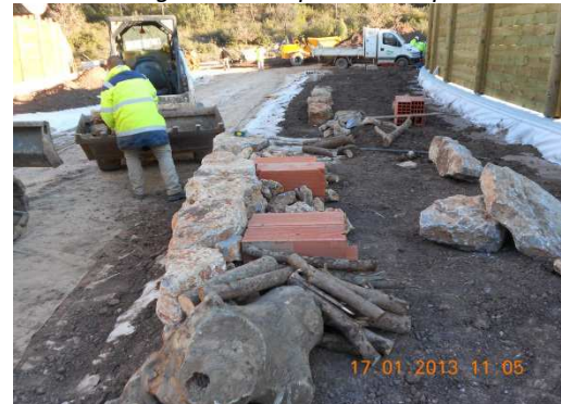
photo 26. ... soit avec des troncs.