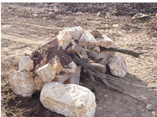
photo 5. Un autre essai avec moins de boisseaux et des matériaux moins imposants, mais une mise en œuvre toujours volontairement « désordonnée ».