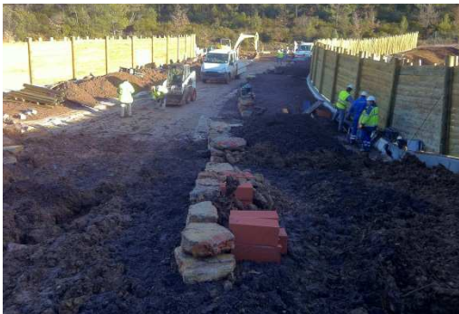
photo 23. Les andains sont progressivement recouverts par les terres de plantation