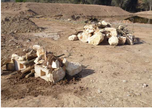
photo 7. Les deux configurations testées en février 2012