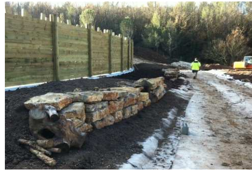
photo 22. Au premier plan, les cavités naturelles de certains troncs (ici, platanes) sont favorables à une colonisation par l'entomofaune.