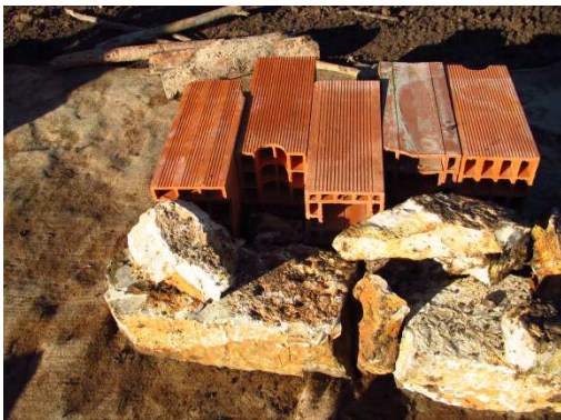
photo 8. Agencement des boisseaux et blocs de face avant. Le géotextile au sol facilitera le démontage du test mais sur l'écopont la mise en œuvre se fera sur une couche de terre sous-jacente.