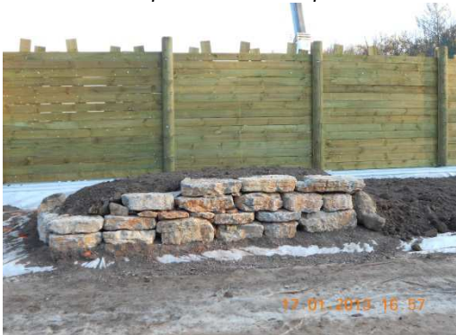
photo 25. Un soin particulier est apporté aux « pignons » pour éviter les érosions et diversifier les habitats : les angles sont consolidés soit avec des dalles de pierre...