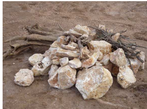
photo 4. Rendu final du test n°1, qui a paru trop encombrant pour un écopont.