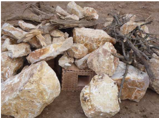
photo 3. Habillage complémentaire avec des pierres et des branchages plus petits mis en œuvre de façon volontairement « désordonnée ».