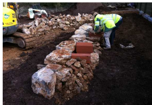
photo 20. Calage manuel des boisseaux et des petites pierres.