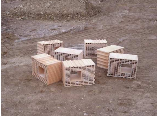
photo 1. Disposition des boisseaux en terre cuite de façon « désordonnée »