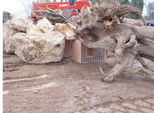
photo 2. Photo 2 - Accompagnement avec des blocs et souches massives