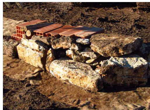
photo 11. Montage des pierres sèches sur la face avant et l'extrémité de l'andain et calage de rondins entre les boisseaux