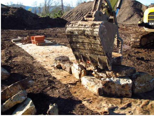
photo 12. Calage à la pelle des dalles de couverture