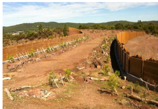
photo 32. L'allure finale est semblable à l'écopont de Brignoles avec sur le bord (à gauche) une éco-restanque intermittente et plantée faisant face (à droite) à des pierriers et dalles erratiques bordés en retrait d'une alignement de troncs.