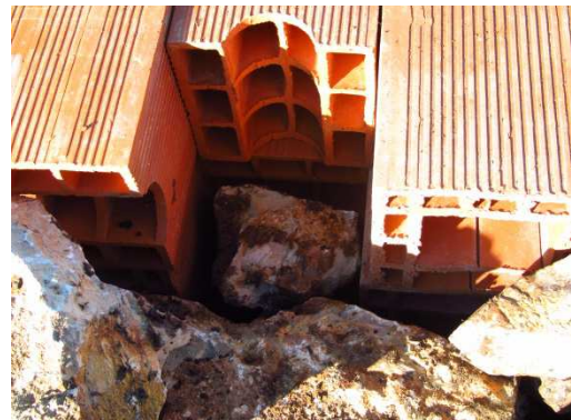
photo 9. Décalage des boisseaux de façon à mieux ancrer le muret de pierres sèches