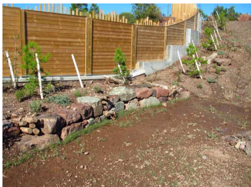
photo 31. L'autre exemple de mise en œuvre avec des matériaux siliceux sur l'écopont de Pignans