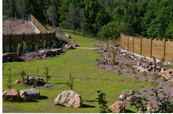
photo 30. Mai 2013 après reprise de la végétation avec, au premier plan, des blocs rocheux anti-intrusion doublés par une barrière métallique spécifique (brevetée).