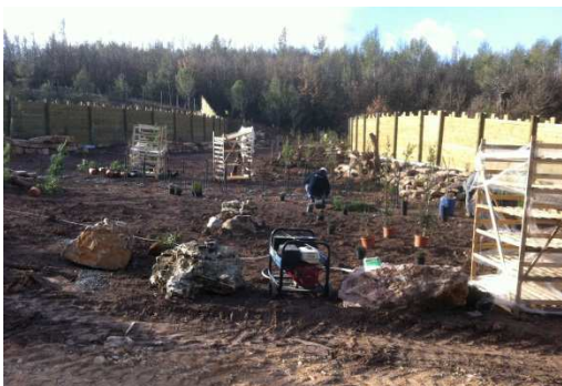
photo 27. Les plantations sont faites en sortie d'hiver 2013.