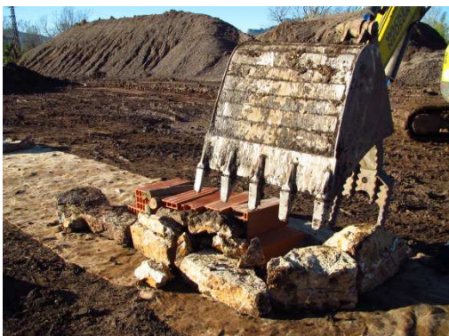
photo 10. Installation à la pelle mécanique des blocs de contour de l'andain