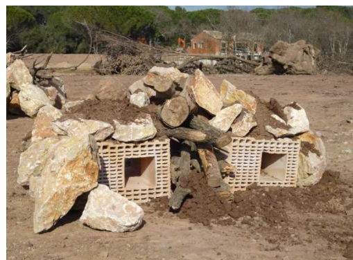
photo 6. Le rendu final du test n°2 est plus proche du schéma initial.