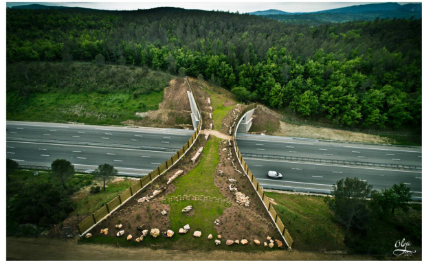
photo 18. Vue générale de l'écopont de Brignoles avec la ligne intermittente des éco-restanques sur le côté gauche de l'ouvrage.

Tous forment au final une ligne pointillée qui traverse longitudinalement chaque écopont sur un linéaire total d'environ 50m en incluant les intervalles vallonnés. Elle n'est présente que d'un côté de l'ouvrage de façon à limiter le cloisonnement.