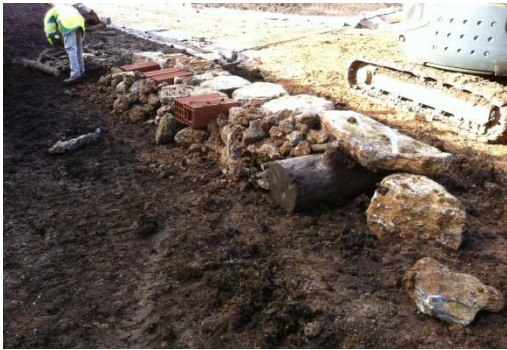
photo 21. Les andains comprennent des bois et souches de dimensions variables.