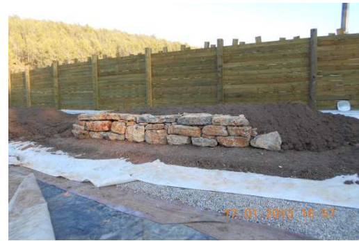
photo 24. Vu d'un andain « brut » recouvert de terre végétale mais pas encore planté