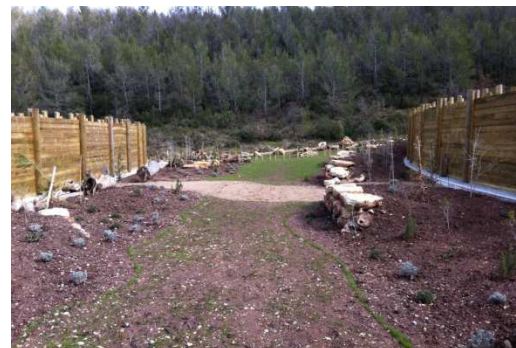
photo 28. L'écopont présente une variété d'habitats avec une zone centrale herbeuse, des arbustes sur les flancs des buttes et des baliveaux plantés sur les terrasses adossées aux « éco-restanques ».