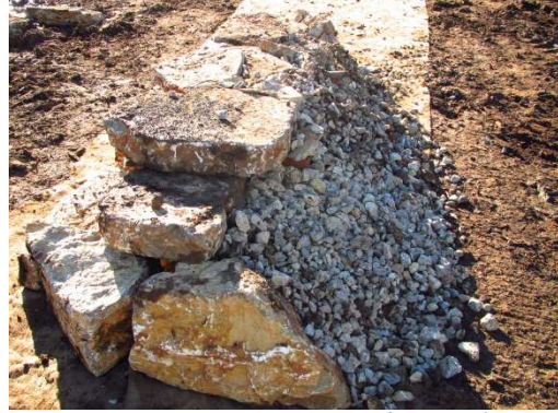
photo 13. Apport de ballast en face arrière pour assurer le drainage et une porosité décroissante vers l'intérieur de l'andain