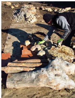
photo 14. Démarrage d'un second module débutant par un billot massif