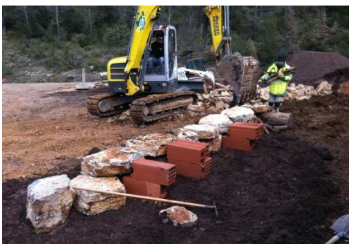
photo 19. les grosses dalles calcaires sont positionnées à la pelle mécanique.