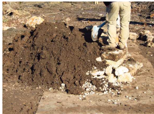
photo 15. Enfouissement de la structure par terre avec mise en forme « manuelle »