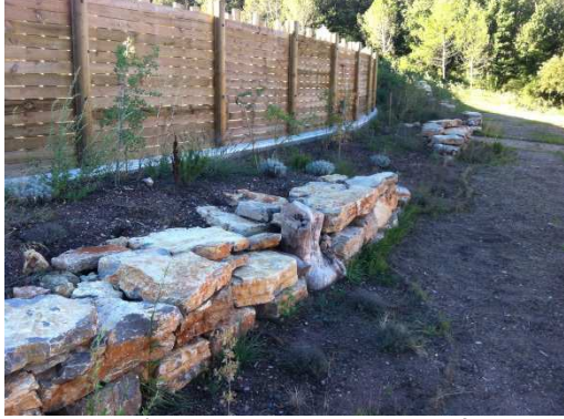
photo 29. L'espacement des modules favorise les circulation animale le long et sur la restanque, et réduisent l'effet- couloir.