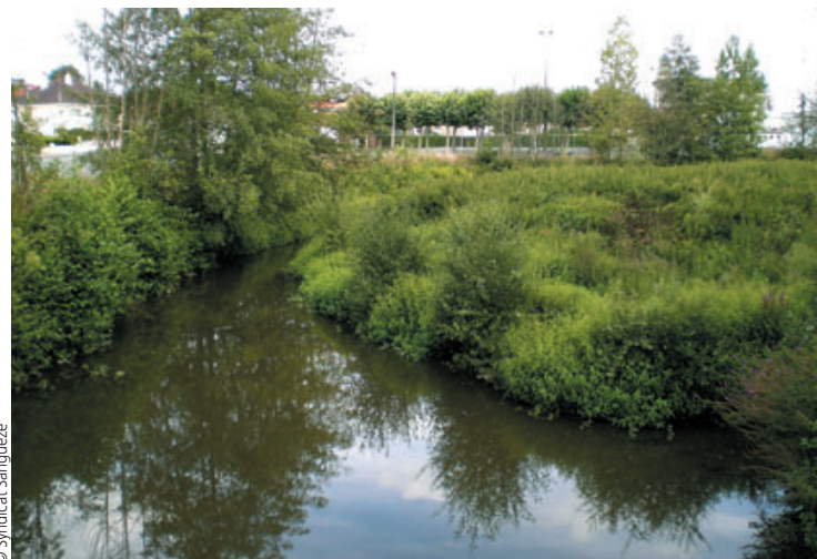
La cuvette de la retenue après les travaux d'abaissement de l'ouvrage de retenue. Le cours d'eau retrouve naturellement un chenal d'écoulement sinueux - 2004