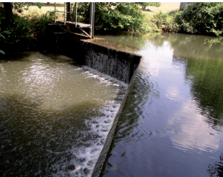
A. Charrier - Institution interdépartementale du bassin de la Sèvre Nantaise