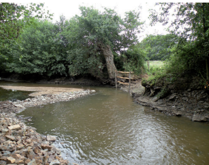
A. Charrier - Institution interdépartementale du bassin de la Sèvre Nantaise