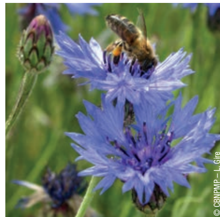
Abeille sur bleuet ( Cyanus segetum ). La flore indigène sauvage est une ressource vitale pour de nombreux insectes pollinisateurs.

Enfin, des effets néfastes peuvent être induits sur d'autres organismes de la