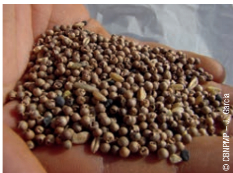
Graines de Bifora rayonnant ( Bifora radians ).