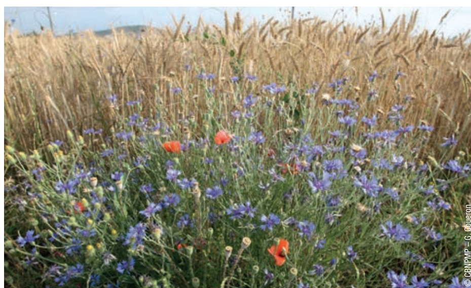
Plantes messicoles en bordure de champs de céréales.

le champ des possibles : la création de filières nationale et régionales pour la structuration d'une offre de semences et de plants d'origine garantie, ainsi que différentes expériences récentes illustrant les enjeux techniques des projets, du transfert de foin à la récolte de semences prairiales. Réunissant plus de 110 professionnels (gestionnaires d'espaces naturels, collectivités, bureaux d'études,