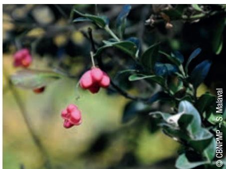
Fusain d'Europe ( Euonymus europaeus ).

de trajectoires d'adaptation plutôt qu'en termes d'états de référence : plus que jamais, les liens entre changement global et biodiversité locale restent une question majeure pour la recherche. ■