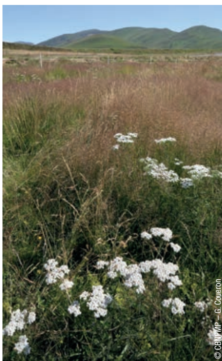
Pâturage de montagne pyrénéenne.