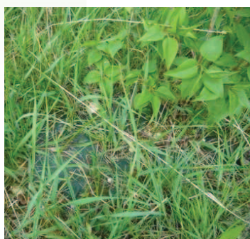
Protection géotextile biodégradable