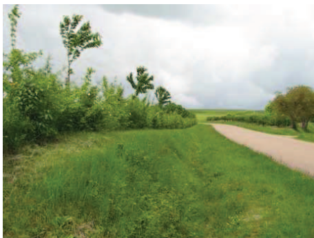
Haie H1, 4 ans après la plantation (2010 )