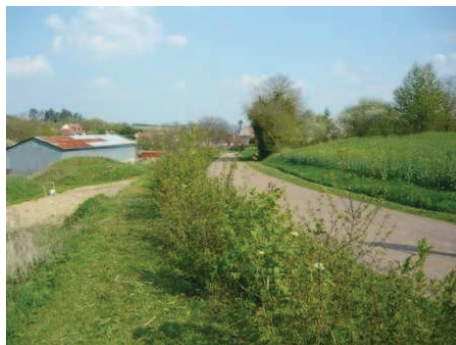
Haie H2, 4 ans après la plantation (2010 )