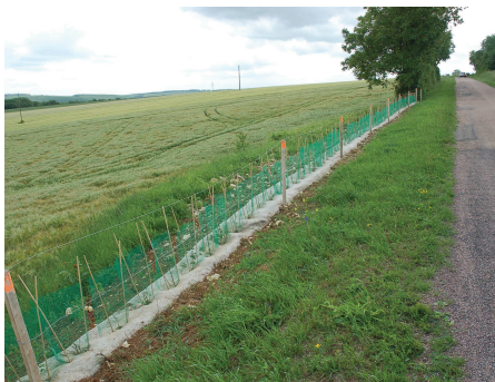
Plantation d'une haie arbustive (Haie H4)