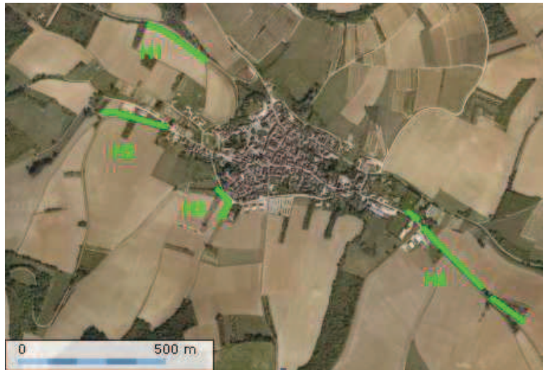
Localisation des 4 haies plantées sur la commune dans le cadre du Plan « Bocage et Paysages »

En 2006, la petite commune rurale de Migé a souhaité planter quatre haies champêtres en vue d'améliorer la qualité paysagère et écologique de ses entrées de village. Près de 800 mètres de haies (H1, H2, H3 et H4) ont été plantées en bord de route. Ce projet communal s'inscrit dans le cadre des appels à projets « Bocage et paysages » soutenus depuis 2005 par le Conseil régional de Bourgogne.