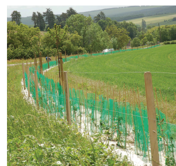
Plantation d'une haie arbustive piquetée d'arbres de haut jet (Haie H1)